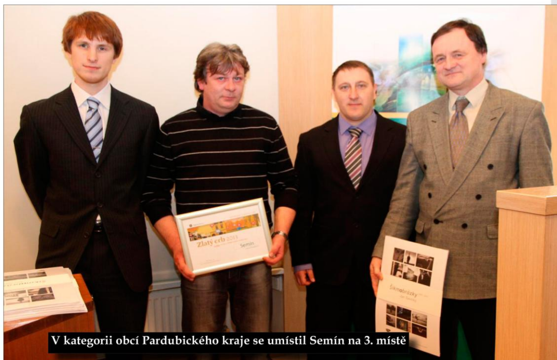
V kategorii obcí Pardubického kraje se umístil Semín na 3. místě