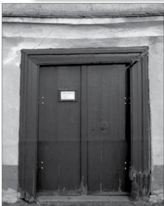
Stav před rekonstrukcí