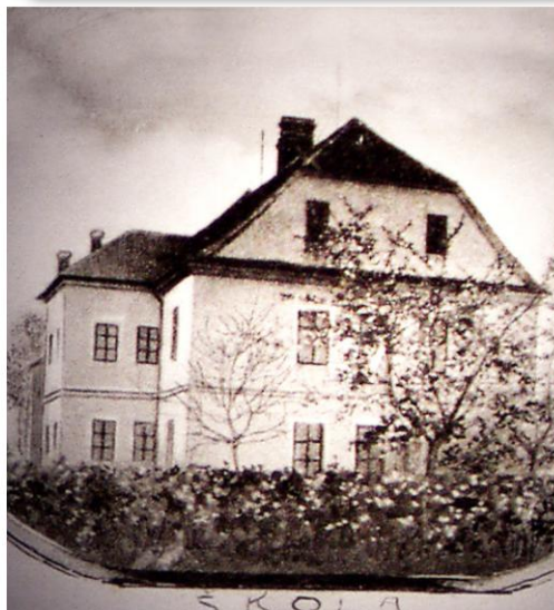
Škola v Semíně (foto z roku 1906)